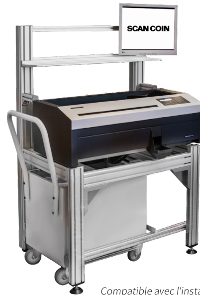
Compatible avec l'installation Contorex E4